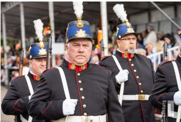
(voorbeeld van een schutterij)

Maandenlang werd er met de directeur van het museum in Znojmo gecorrespondeerd over de verschillende items + de te exposeren voorwerpen + het transport naar Harderwijk + de veiligheidseisen aan dit transport + de veiligheidseisen die aan het exposeren van historische wapens kleven + enz. enz. Al snel bleek het een complexe materie waaraan -volgens de Nederlandse wetgeving- nogal wat zaken geregeld moesten gaan worden. Maar ook de eisen die er bij musea aan het transport van historisch materiaal gelden moesten worden nagekomen. Maar hoe konden wij dit vanuit Harderwijk allemaal regelen? De directeur van het museum aldaar correspondeerde moeizaam, telefonisch maakte hij zich onvindbaar, van internationale transporten hadden wij allebei geen verstand, enz.